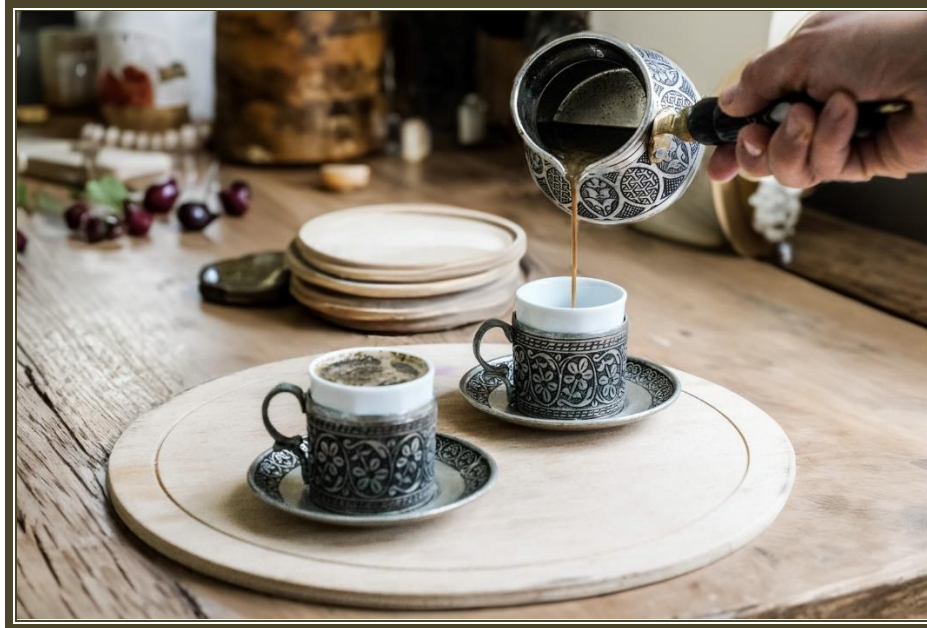
Bakır Cezve ve Fincan Takımı ile Kahve Su

21 Haziran 2022 tarihinde ise, enstit m ze tahsis edilen bina bah esinde satıŐ mağazamıza ilave olarak; geleneksel Őerbetlerimiz, T rk kahvesi, Menengi  kahvemiz ve menengi  unundan yapılan kurabiyelerimizle kafeteryamız da hizmete girmiŐtir.