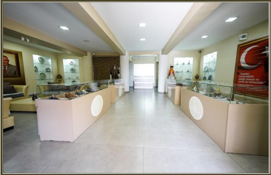
Enstitü Ana Hizmet Binası (Giriş)

Tanıtım Pazarlama Birimleri faaliyet göstermektedir.