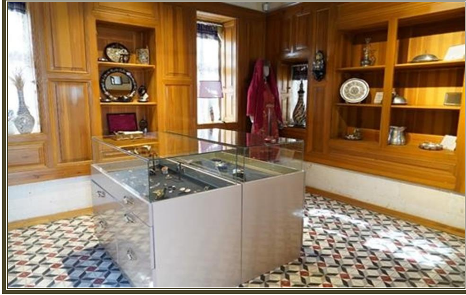
K lt r ve Sanat Merkezi (SatıŐ Mağazası)

2018 yılında Büyükşehir Belediyesi tarafından enstitümüze tahsis edilen tarihi Sinagog'da ilk K lt rve Sanat Merkezimiz a ılmıştır. Daha sonra, Őhitk mil Belediyesi tarafından Enstit m ze 10 yıllığına tahsis edilen tarihi Antep Evi; K lt r ve Sanat Merkezi olarak 2021 yılında faaliyete ge miştir.