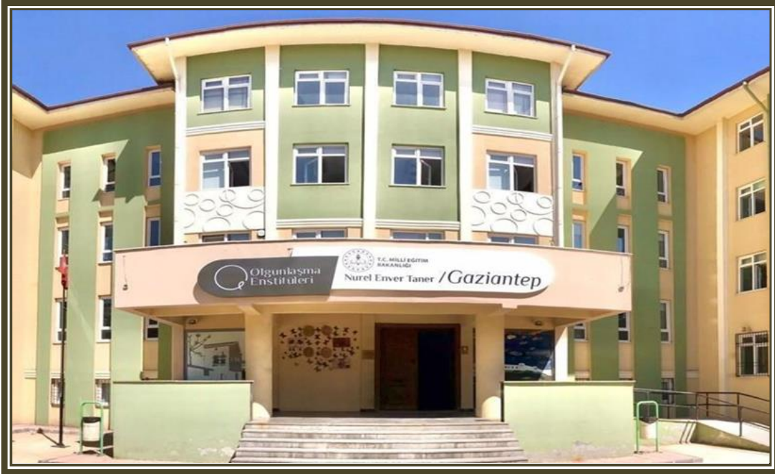
Enstitü Ana Hizmet Binası

Enstitümüz; Gaziantep, Şanlıurfa ve Kilis yörelerine ait kültürel değerlerimizi ve özellikle unutulmaya yüz tutmuş geleneksel sanatlarımızı araştıran, asıllarını koruyarak inovatif ürünler tasarlayan ve üreten, arşivleyen, gelecek kuşaklara aktarılmasını sağlayan, bunların ulusal ve uluslararası alanlarda sergi, fuar, defile vb. etkinliklerle tanıtılmasını sağlayan, teknolojik gelişmelere paralel olarak sektörde yer alacak yeni nesil ustalar yetiştiren, eğitim ve öğretimin yanı sıra araştırma, tasarım, üretim, tanıtım ve pazarlama süreçlerinin tümünü gerçekleştiren bir kurumdur.